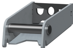
ITR classic Adapter plate ITR wende Adapterplatte