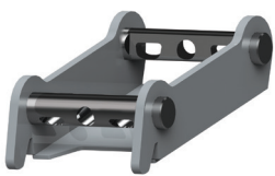
ITR reversible Adapter plate ITR klassische Adapterplatte